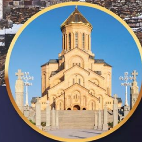
มหาวิหาร ศักดิ์สิทธิ์บิลีซี