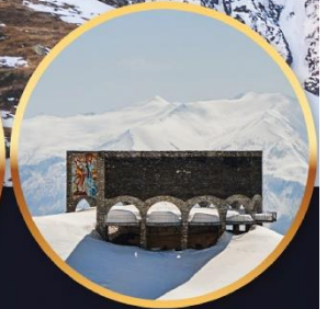
อนุสรณ์สถาน รัสเซีย - จอร์เจีย