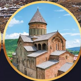
วิหารสเวตสเคอเวลี